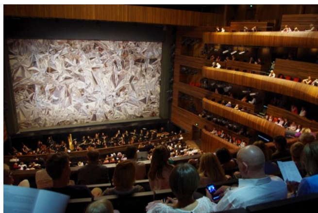
Prostory koncertní síně s oponou nové scény Opery v Oslo