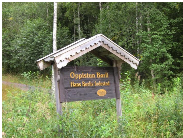
Børli Oppistun – rodiště norského literáta Hanse Børliho (1918 – 1989) a místo každoročního konání festivalu JUNIKVELD.

Realizace projektu byla podpořena z Fondu pro bilaterální spolupráci na národní úrovni v rámci EHP a Norských fondů 2009 – 2014