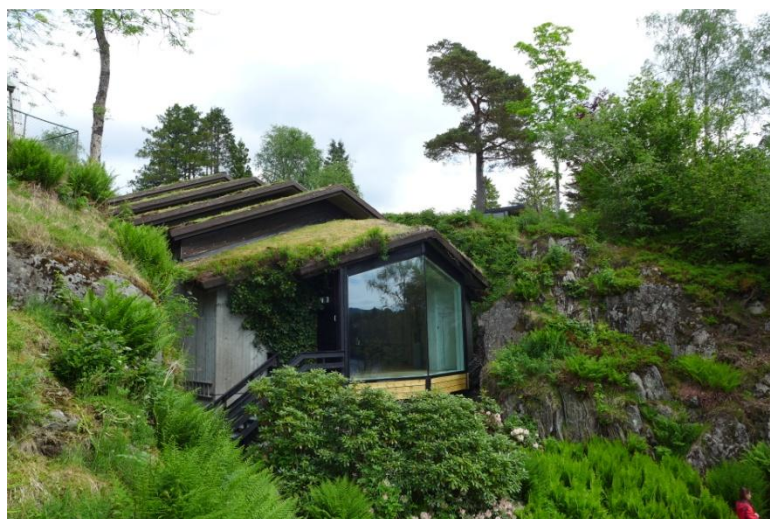
Citlivě s přírodou splývající moderní koncertní sál v Trolldaugen, skýtající jedinečné akustické podmínky.