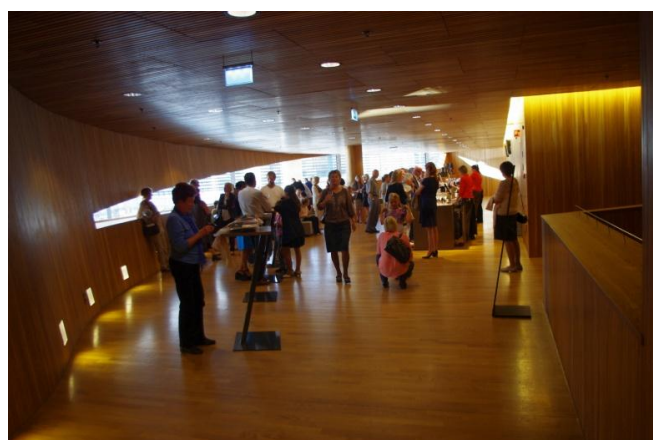
Přísálí a společenské prostory Opery v Oslo