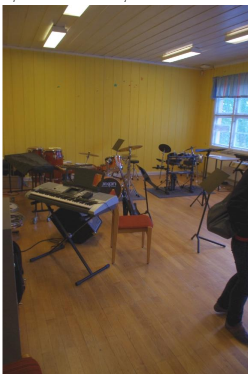
Učebna elektronických nástrojů