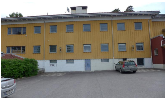
Návštěva v Eidskog Kulturskole - budova školy. Probíhá zde výuka hudebního, výtvarného a dramatického uměleckého oboru.