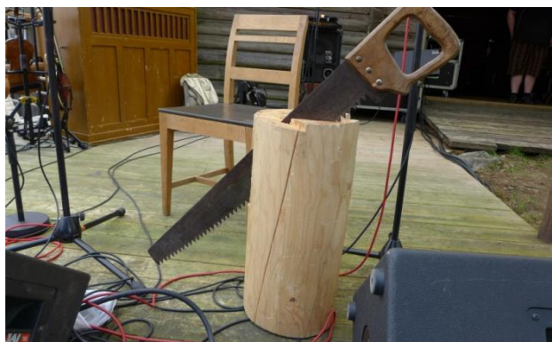
Atributy, charakterizující na připraveném jevišti občanské povolání dřevorubce Hanse Børliho, básníka „se sekyrou a pilou“