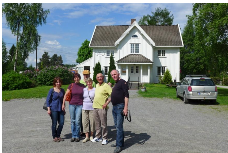
Galleri Lyshuset ve Skarnes s expozicí norského malíře Kare Tvetera