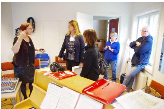
Diskuze nad způsoby uměleckého vzdělávání v Norsku a ČR, jeho specifiky a odlišnostmi.