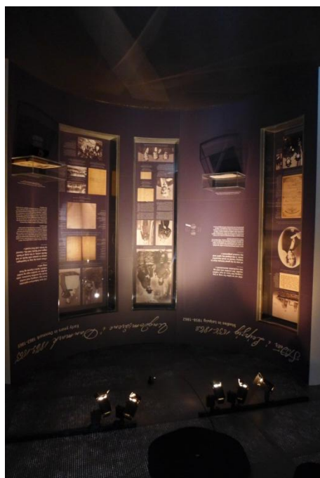
Muzeum a expozice norského skladatele Edvarda Griega